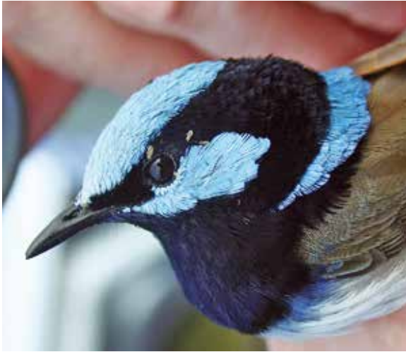
Abb. 3: Vier am Auge des verhaltensauffälligen Prachtstaffelschwanzes Malurus cyaneus cyanocephalus sitzende Federlingslarven ( Myrsidea sp., Menoponidae s. l.). Zwei trinken am Lidrand Augensekret, die anderen sind auf dem Weg dahin. Alle Larven weisen schwarzen Darm- und/oder Kropfinhalt auf, der von gefressenen Federteilchen herrührt. 8.9.2011, Myall Lakes National Park, New South Wales, Australia. – Four feather louse larvae ( Myrsidea sp., Menoponidae s.l.) sitting at the eye of the Superb Fairy-wren Malurus cyaneus cyanocephalus . Two are drinking eye secretion at the edge of the eyelid, the others are on their way there. All larvae show black intestinal and/or crop contents, which are consumed feather fragments.

men. In der Hand gehalten, zeigte sich rasch ein Befall mit Federlingen. Von der Ohrgegend her waren auf der einen Seite zwölf, auf der anderen ca. acht Larven von wahrscheinlich allen drei Stadien einer Myrsidea -Art aus dem Federkleid aufgetaucht und krabbelten flink zu den Augen hin. An den Lidrändern labten sie sich für ca. 10 bis 40 Sekunden an der Tränenflüssigkeit (Abb. 3).